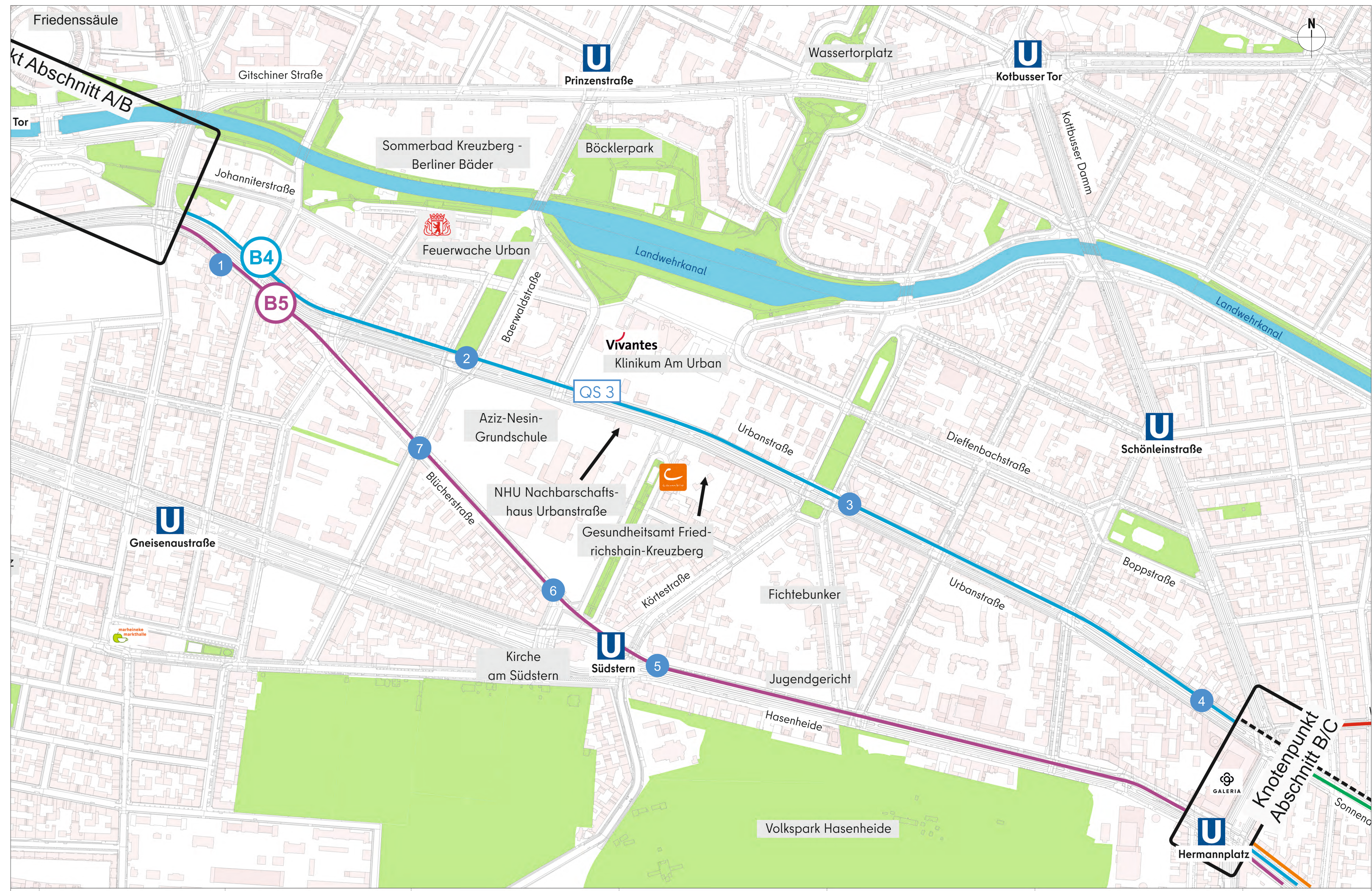
Verbleibende Trassenvarianten in Stufe 2 des Trassenvergleichs, Abschnitt B