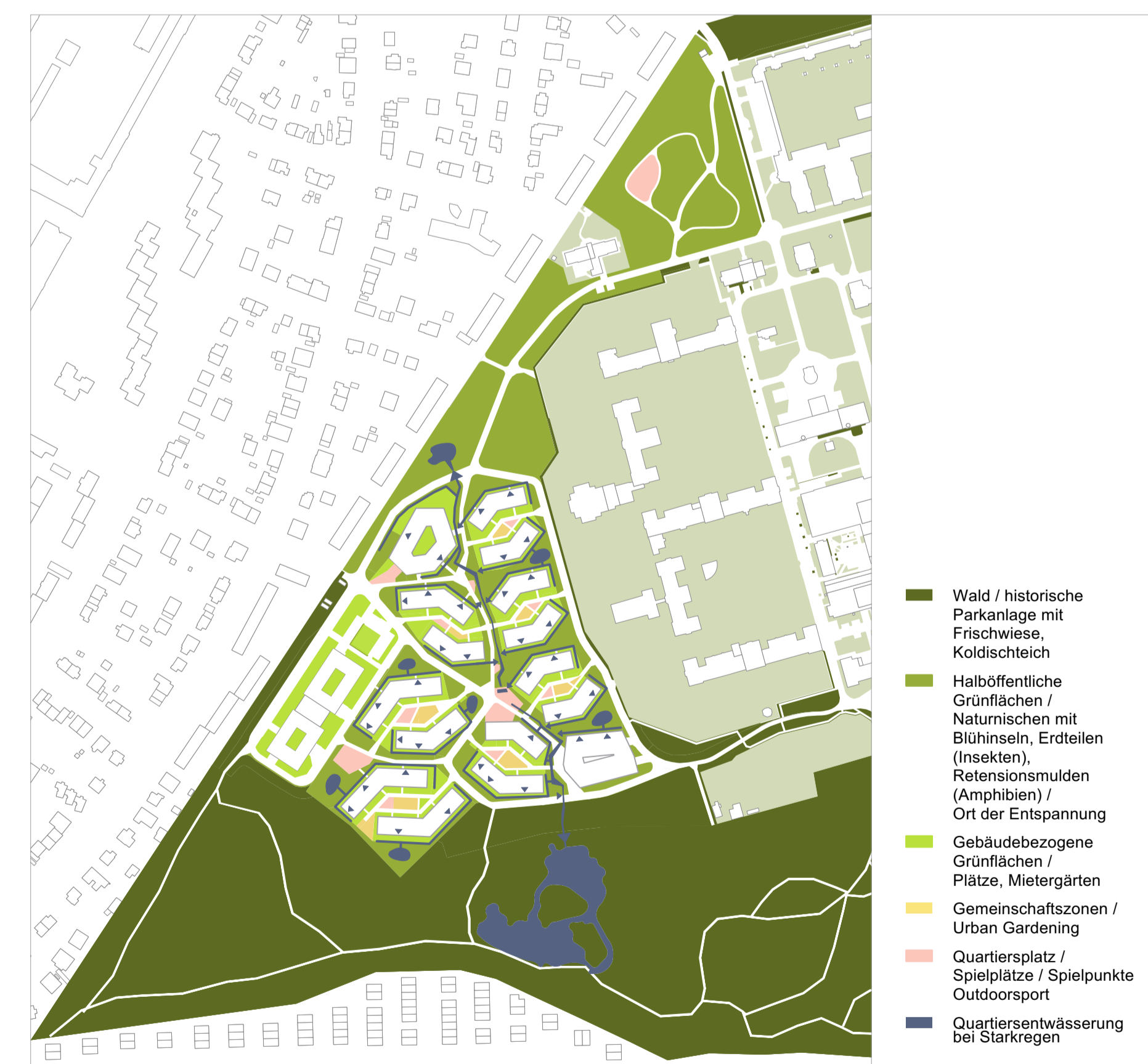
Freiraum- / Regenwasserkonzept