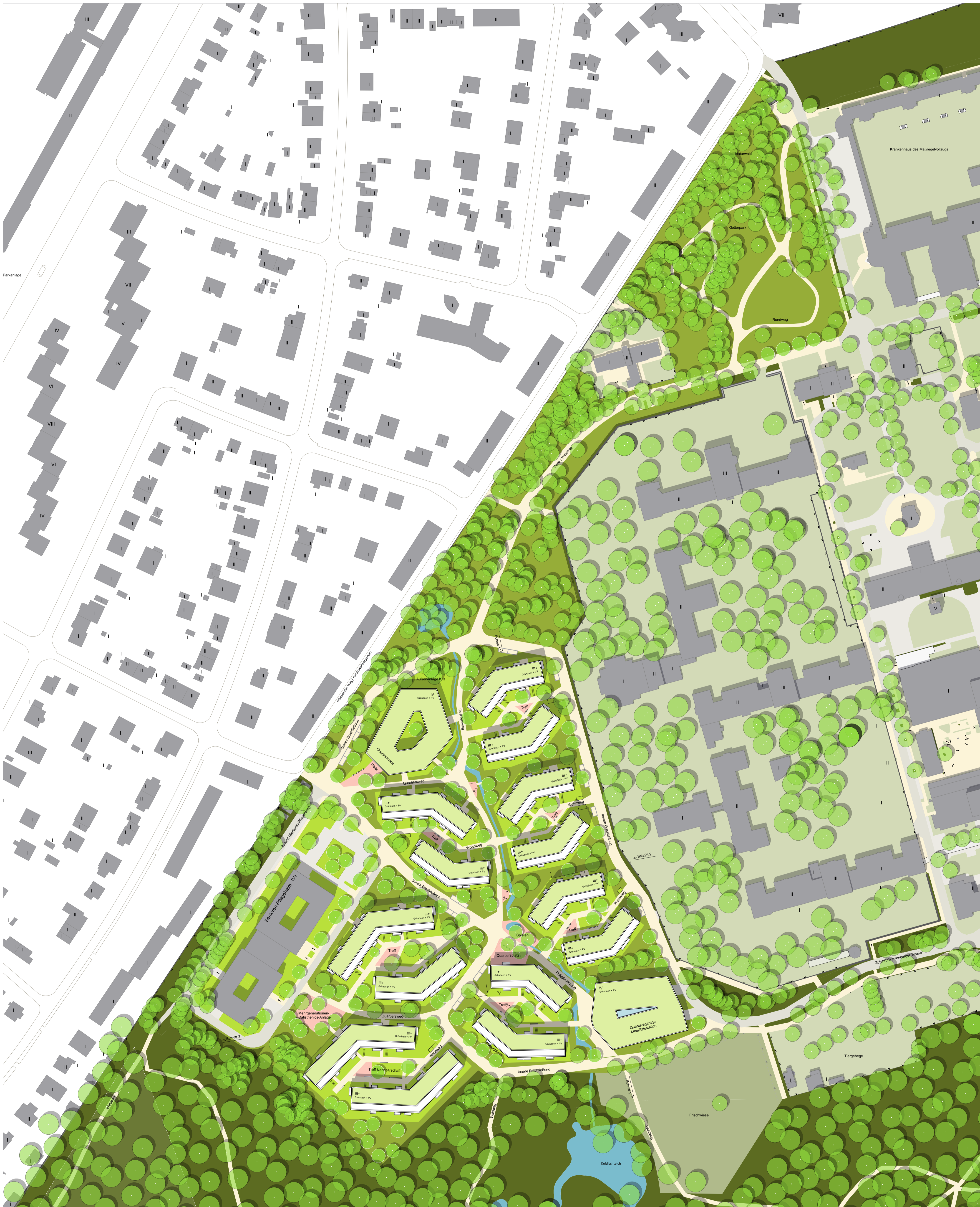
Städtebauliches Konzept M 1:1.000 (Dachaufsicht)