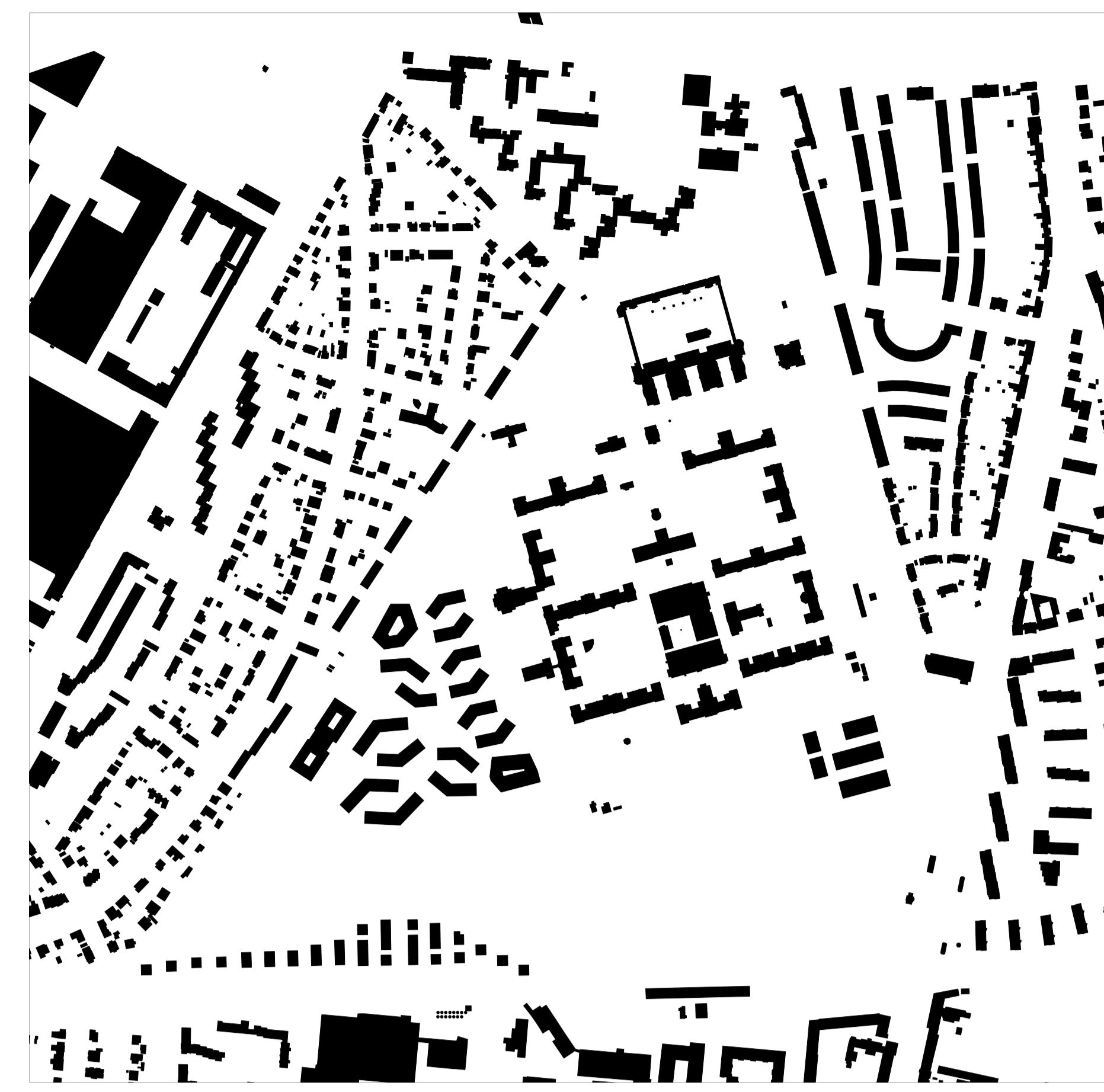
Stadtstruktur M 1:5.000