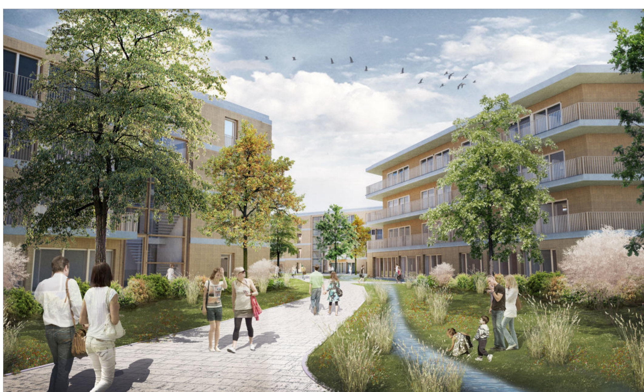
Blick Quartiersweg mit Quartiershaus