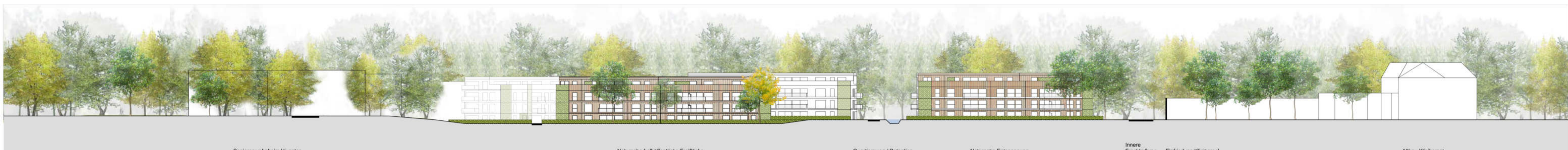
Schnitt 1 M 1:500