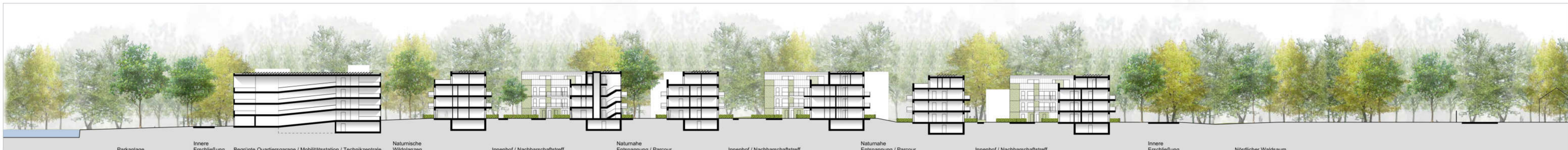
Schnitt 2 M 1:500