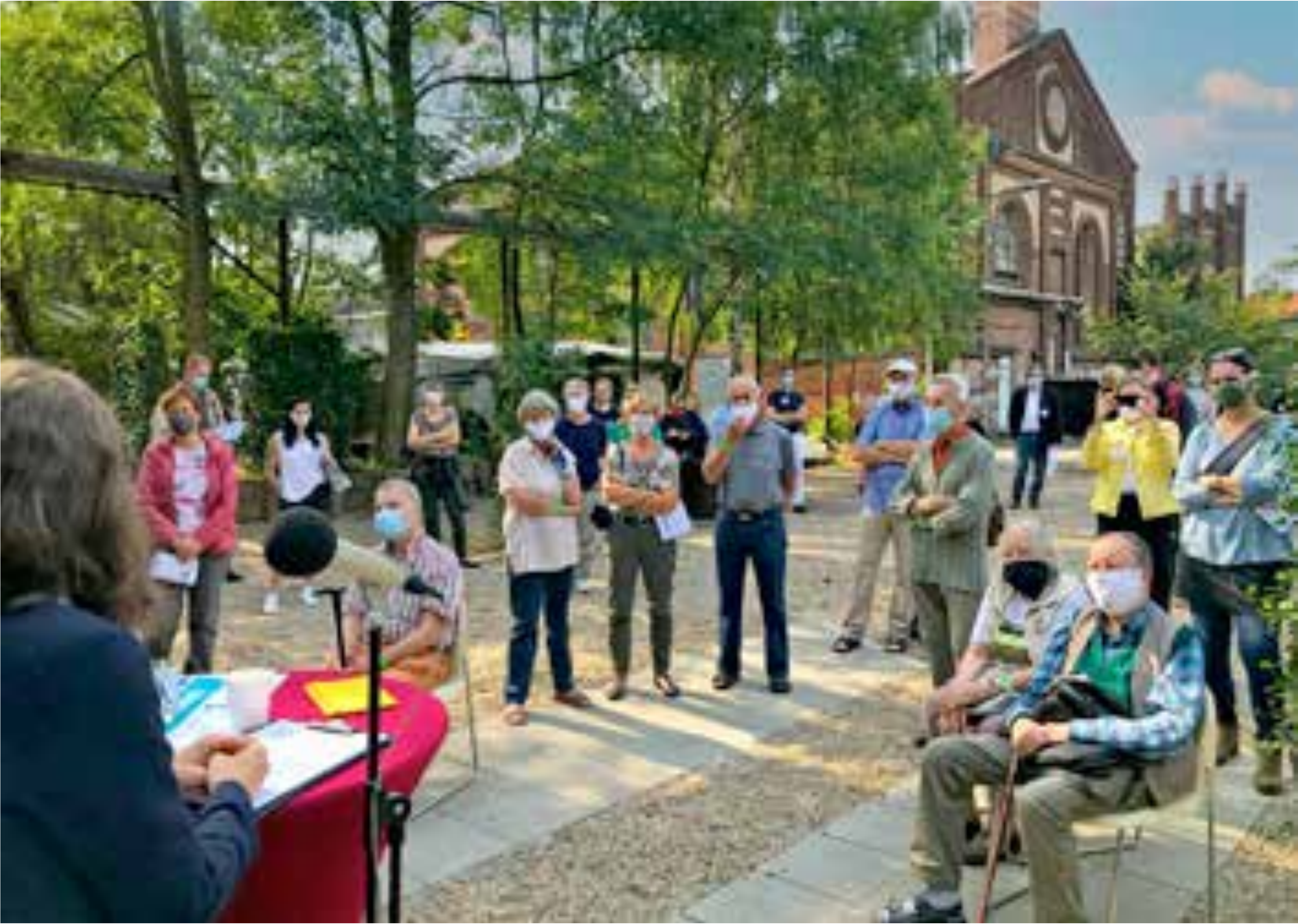
Informationsveranstaltung, September 2020

Auf seiner Grundlage können nun die Bebauungsplanung sowie die Objektplanung konkreter Projekte, wie von öffentlichen Plätzen oder Straßenräumen, erfolgen. Parallel dazu werden bereits erste Maßnahmen durchgeführt. Dazu zählen neben dem Abtrag ruinöser Gebäude auf dem Güterbahnhofsgelände die Errichtung einer Grundschule auf dem Gelände des ehemaligen Gaswerks. Zudem wurde im September 2025 das Vor-Ort-Büro der Entwicklungsmaßnahme eröffnet.