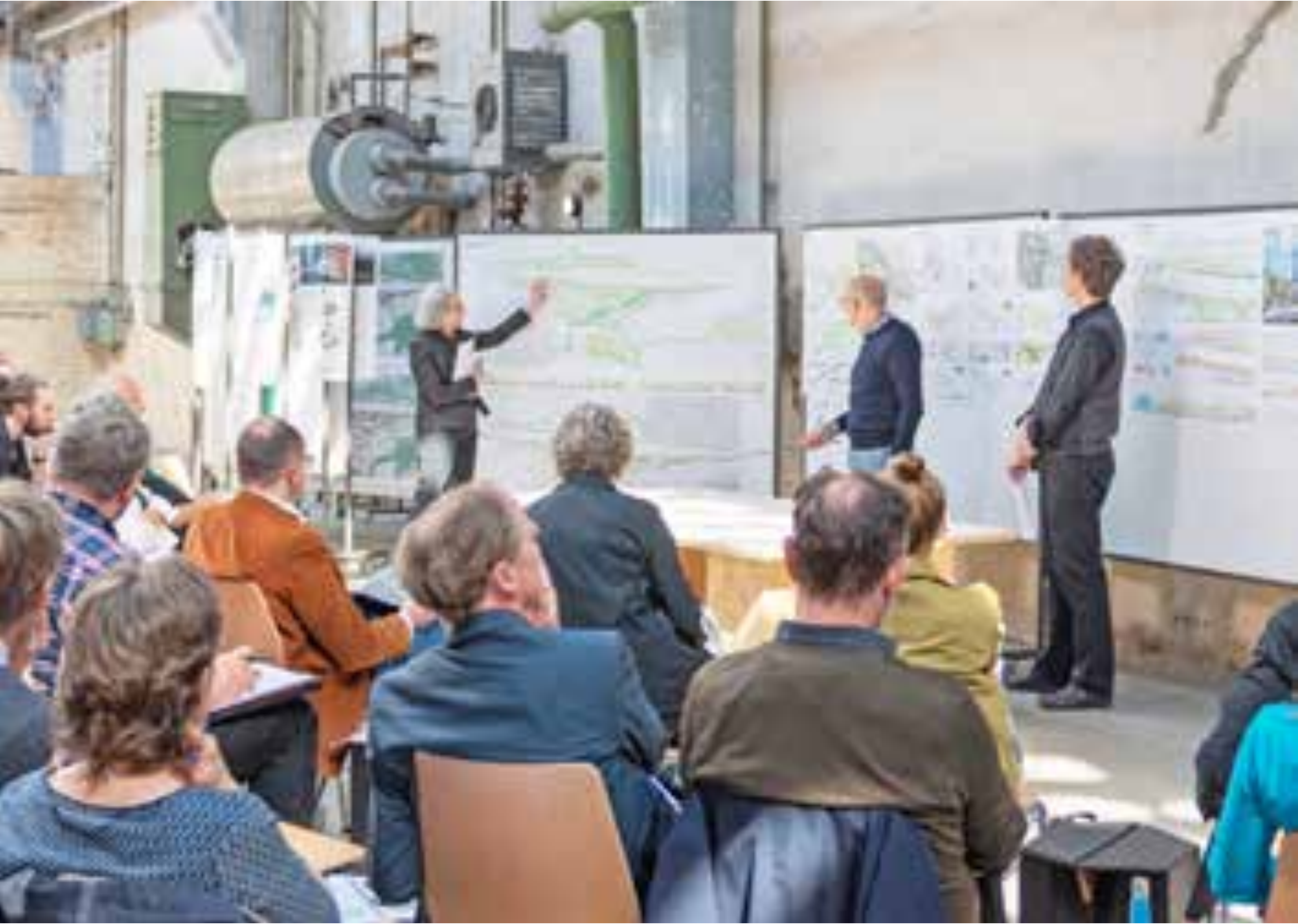
Beratungsgremium des Werkstattverfahrens, Mai 2023