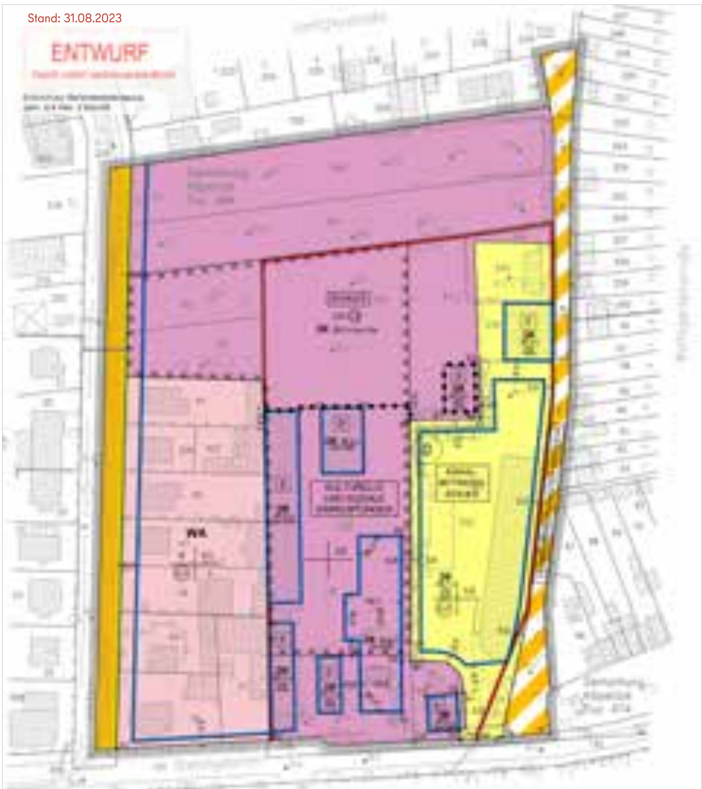
B-Plan 9-80 © Senatsverwaltung für Stadtentwicklung, Bauen und Wohnen