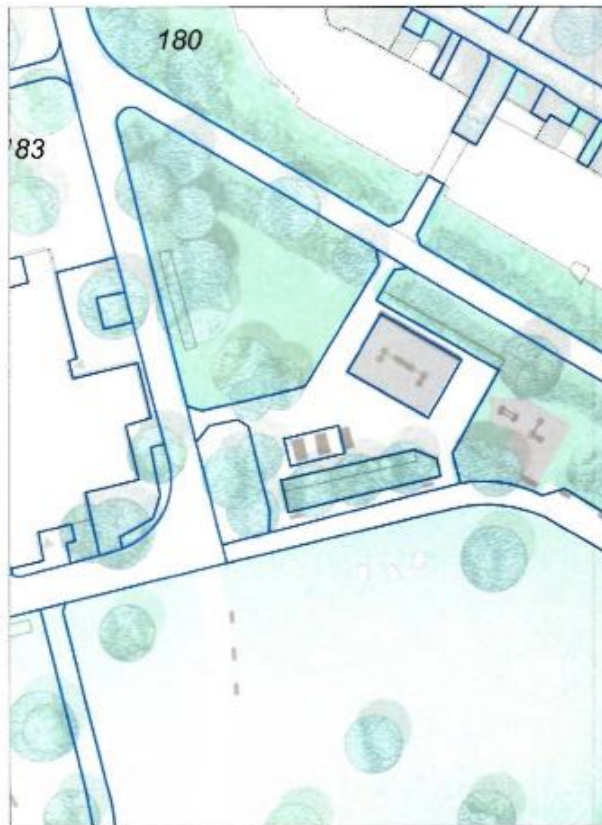
Fitnessplatz / Vermessunggrundlage