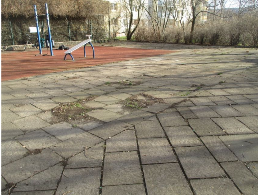
aktuelle Situation Frühjahr 2020