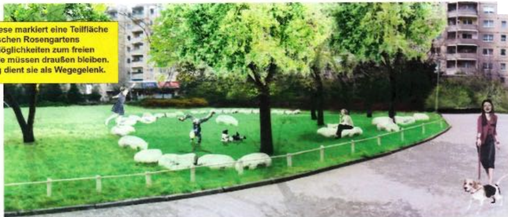
Konzeptskizze, Monolithischer Parcours

geplante Maßnahmen gemäß Konzept BGMR vom 22.08.2018