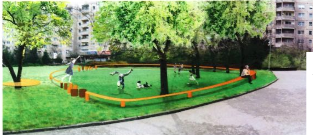
Konzeptskizze, Rundrohr Parcours