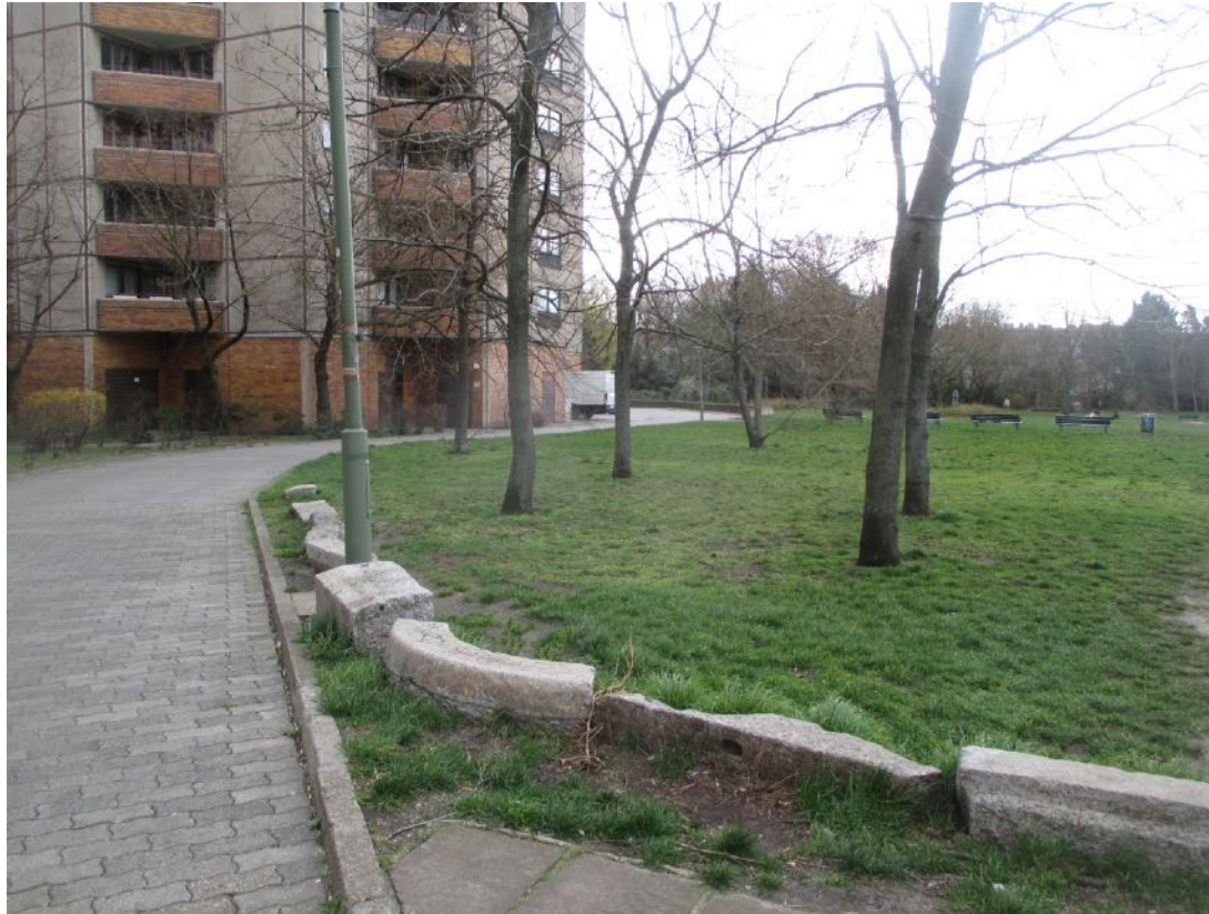
aktuelle Situation Frühjahr 2020