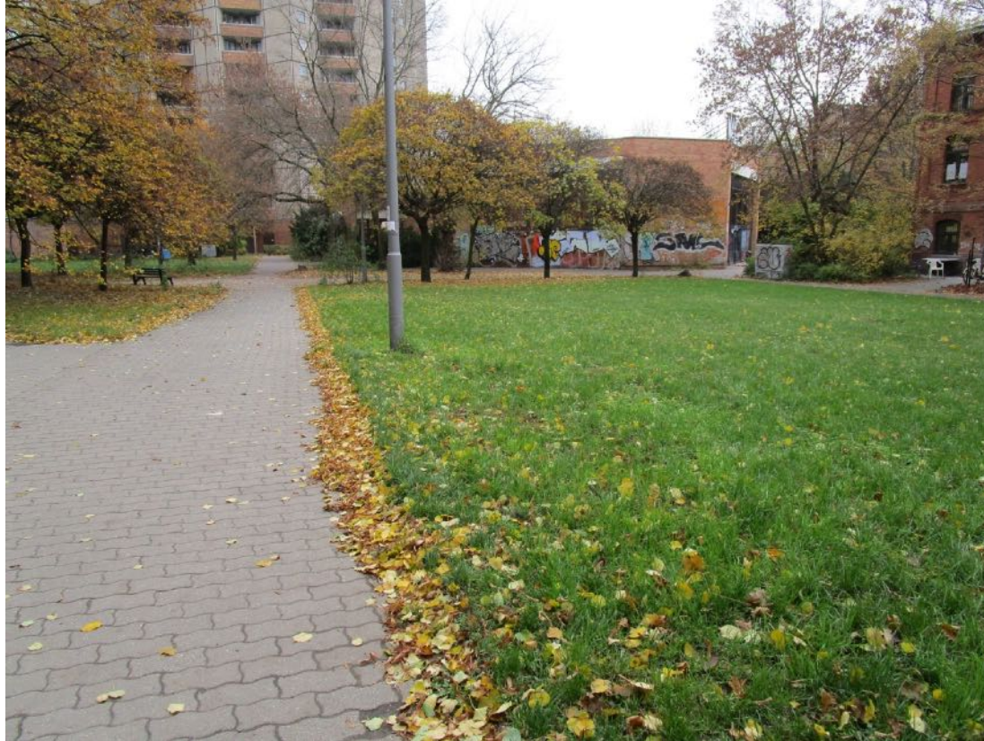
aktuelle Situation Frühjahr 2020