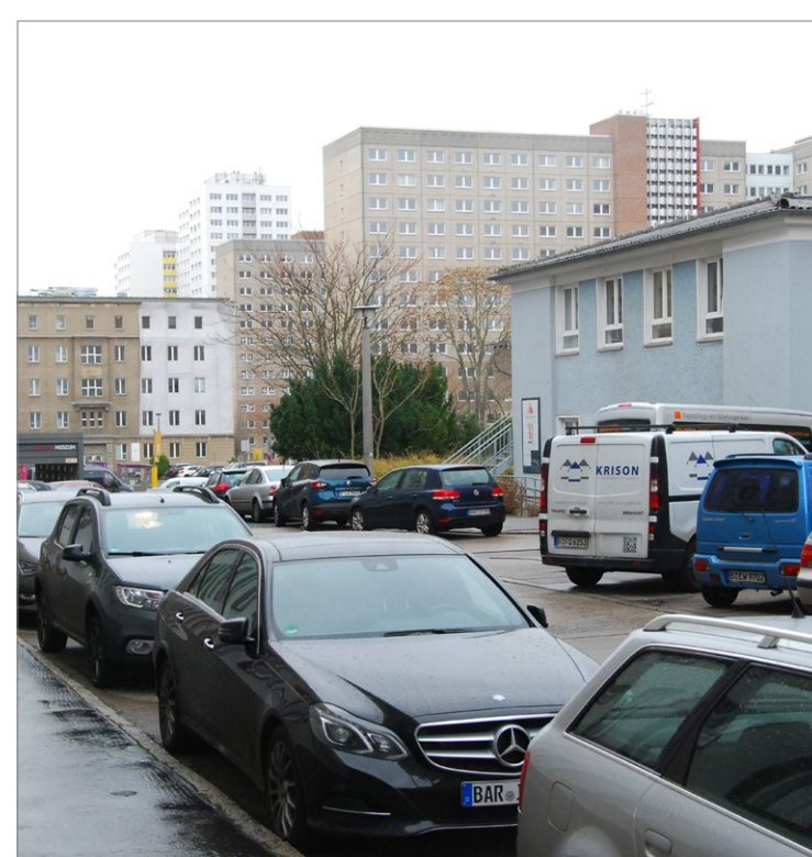
© Planergemeinschaft für Stadt und Raum eG | 2019

Vorliegende verkehrsplanerische Konzepte sollen im Kontext des Stadtumbaugebietes bewertet und ggf. fortgeschrieben werden.