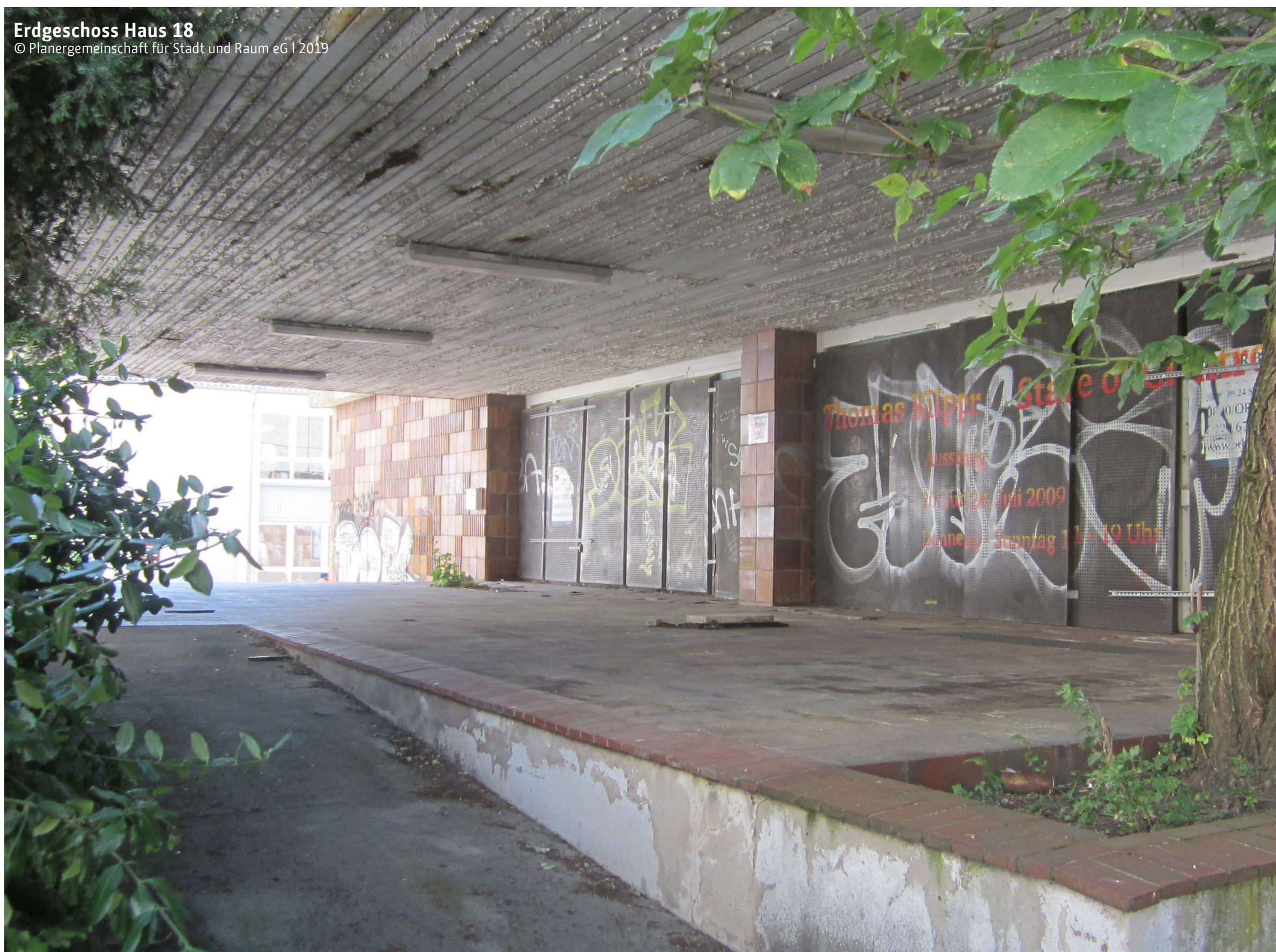
Erdgeschoss Haus 18 © Planergemeinschaft für Stadt und Raum eG | 2019

Das Leitsystem soll ergänzt und erweitert werden.