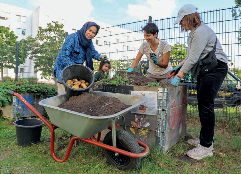
Gemeinschaftsgarten an der Unterkunft Wartenberger Straße

Zu Besuch beim BENN-Team* in der Warnitzer Straße