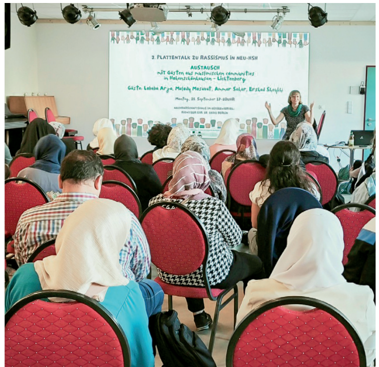
Die Plattentalks finden im Verein für aktive Vielfalt (VaV e. V.) statt

Außerdem fällt mir das Bürgeramt ein, das hoch frequentiert ist, jetzt aber für mehrere Monate schließen musste, weil man mit Wohnungsdarstellungen nicht hinterherkam. Wo geht man dann hin mit seinen Anliegen? Und dann hatten wir große Probleme mit Kellerbränden,