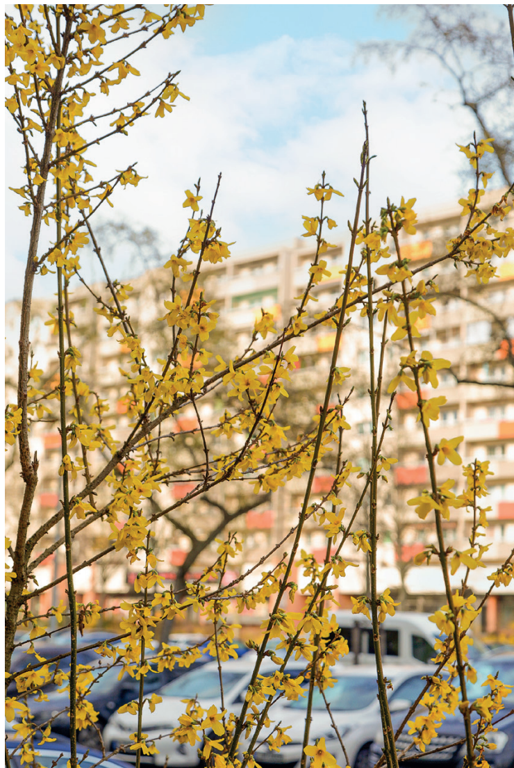
Natur und Stadt - in der Großwohnsiedlung nah beieinander

Die Meinungen reichen von aufgeschlossen bis ‚na endlich‘, aber auch ‚na, das wird doch wieder nichts‘. Es gibt einige Projekte im