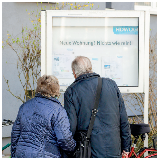
Wohnraum ist auch hier im Kiez inzwischen knapp

Man kann auf jeden Fall sagen, dass das Gebiet vielfältiger wird: Langjährige Anwohnende werden in neuen Nachbarschaften zusammenleben. Das ist bestimmt auch mit Vorurteilen und Konflikten verbunden. Es wird Auswirkungen auf