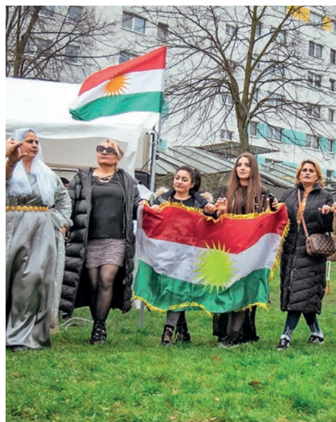
Das persisch-kurdische Frühlingsfest Nouruz bringt die Nachbarschaft zusammen

Herz und Seele der BENN-Arbeit sind aber weiterhin die Integrationsangebote. So wird Sozialberatung hier in Neu-Hohenschönhausen auf Farsi, Dari, Arabisch, Vietnamesisch, Ukrainisch, Russisch und natürlich auch auf Deutsch angeboten. Denn im Dschungel der Ausländer- und Sozialgesetzgebung kann man sich auch als deutscher Muttersprachler leicht verirren,