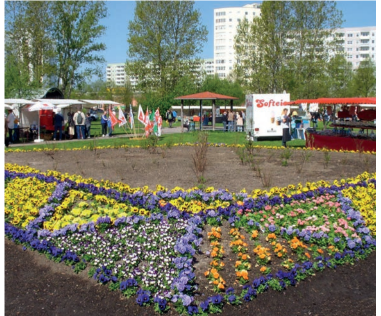
Familienfest „Bunte Platte“ im Park am Warnitzer Bogen

Wir bedienen uns einer externen Unterstützung durch eine Schnittstellenanbindung bei freien Trägern. Vor allem die Stadtteilkordinationen, die in Lichtenberg als Lotsen und Vernetzer vor Ort fun-