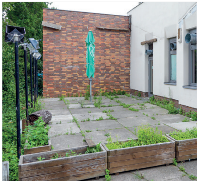
Außengastronomie gibt es kaum im Kiez. Auch dieser Biergarten wird nicht mehr bewirtschaftet

Und was denkt die Bevölkerung, ist sie mit dem Angebot einverstanden? Grundsätzlich sind wir auf eine hohe Zufriedenheit mit dem Gewerbeangebot getroffen. „Kann nicht meckern“, fasst ein älterer Herr seine Sicht mit Berliner Understatement zusammen. Mehrfach allerdings wird der bis 2020 im Linden-Center beheimateten Kaufhof-Filiale nachgetrauert. „Wenn ich heute Haushaltswaren oder Geschirr brauche, bekomme ich das hier nicht mehr“, beklagt sich ein älterer Mann. Mit dem Angebot insgesamt habe er sich aber „arrangiert“, wie er es lächelnd nennt. Auch mal