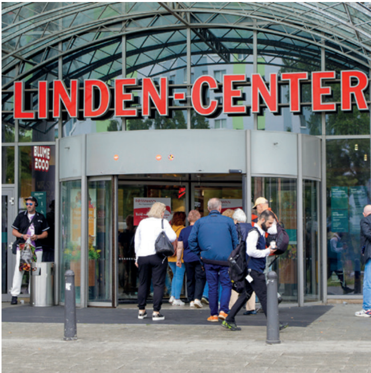
In Sachen Nahversorgung geht in Hohenschönhausen nichts am Linden-Center vorbei

In Neu-Hohenschönhausen gibt es eine große Anzahl Gewerbeflächen, also Orten, an denen Menschen sich aus verschiedenen Gründen begegnen. Größter lokaler Anbieter ist die HOWOGE, genauso wie bei Wohnungen. Sie verfügt in Neu-Hohenschönhausen über rund 200 Gewerbeeinheiten, wie Annemarie Rosenfeld aus der Pressestelle des Wohnungsbauunternehmens auf Anfrage mitteilt. Diese Gewerberäume liegen nicht ausschließlich im Erdgeschoss, teilweise auch im ersten oder zweiten Stock. Das Gros dieser Flächen befindet sich in der Ladenpassage Zingster Straße, am Warnitzer Bogen und in der Grevesmühlener Straße.