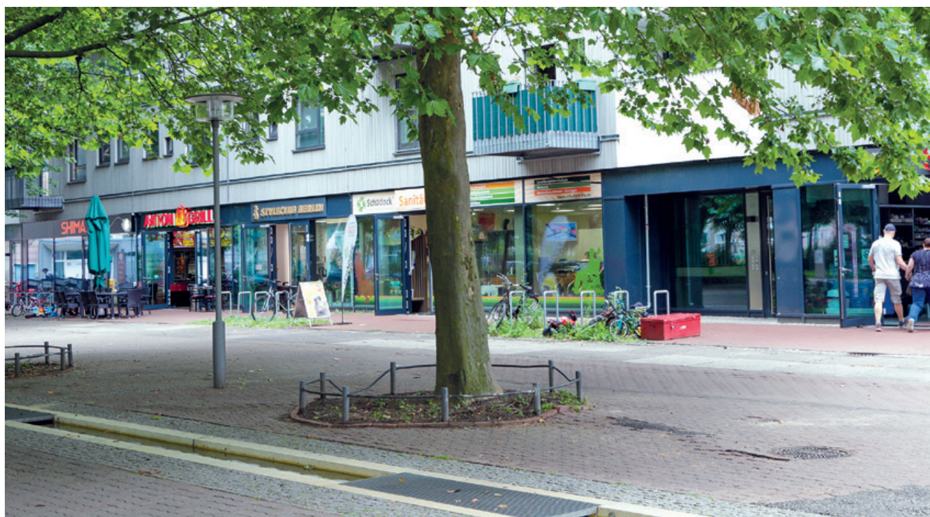
Hier im Mühlengrund fehlt vielen ein Straßencafé