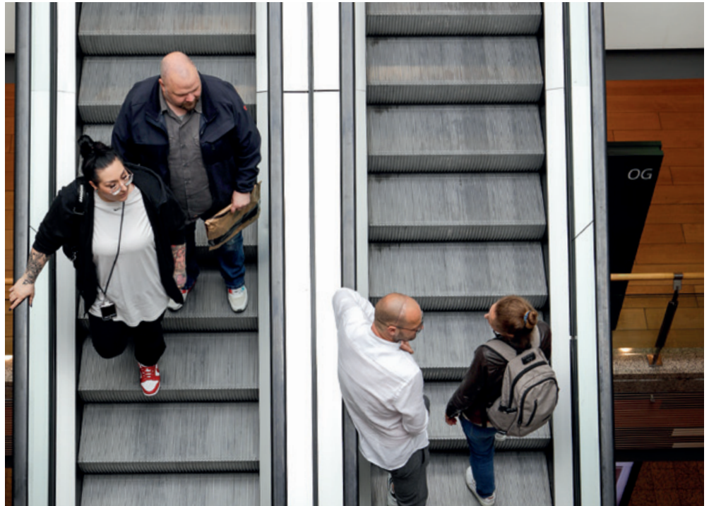
Das Linden-Center hat eine Geschichte mit „Ups“ und „Downs“. Die Schließung von Galeria konnte kompensiert werden.

SR: Ja, wir gestalten viele Aktivitäten in Kooperation mit dem Bezirk. Die letzte größere Aktion waren die 29. Lichtenberger Sozialtage am 5. und 6. Juni. Da waren