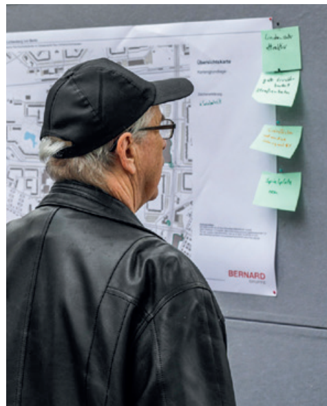
Auf Klebezetteln werden die Anregungen der Nachbarschaft gesammelt